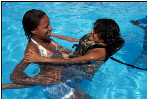
As crianças da Recanto se divertiram na piscina, acompanhadas das obreiras.

Uma das meninas que participaram do grupo de King's Kids mora em uma casa para meninas de rua administradas pela JOCUM de Belo Horizonte. Ela havia perguntado se todas as meninas da casa poderiam vir ao ND durante os cinco dias do feriado de Carnaval. Foi o primeiro grupo de meninas que tivemos. Ao mesmo tempo, durante o feriado, estava acontecendo um acampamento dos membros da igreja Filadélfia de Itabirito, na fazenda em frente ao ND, do outro lado da rodovia. Eles nos convidaram a participar dos cultos e também de uma festa à fantasia. Participamos com eles durante todas as tardes – nós e o grupo de meninas –, e o povo da igreja foi muito amigável e a música era bastante avivada. As meninas adoraram!