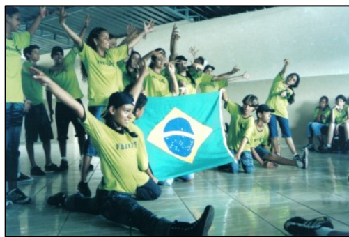
Apresentação do King's Kids na Casa Lar de Itabirito.

Nos foi solicitado receber um grupo de 60 crianças, mais adultos de apoio. A princípio pensamos “de jeito nenhum!”, mas depois, debatendo e orando, concluímos que seria uma grande bênção para Itabirito e uma experiência para nós no ND. Então, King's Kids Brasil (de JOCUM, uma organização internacional que mantém grupos como este em países de todo o mundo com o objetivo de evangelizar através da arte da música e dança) veio e encheu a fazenda de pessoas e alegria. Foram feitas apresentações na principal praça da cidade e também para crianças da Casa Lar. Esse grupo de jovens artistas era formado por crianças de diversos estados do Brasil que se juntaram para treinar por algumas semanas e se apresentar nas principais praças de Belo Horizonte. Foi fantástico tê-los em Itabirito também, pois muitos passantes pararam para assistir e ouvir a mensagem. As crianças de